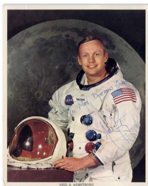
Рис.2. Нейл Армстронг (1930 -2012) астронавт НАСА, первый человек, ступивший на Луну 20 июля 1969 года.

Необходимость освоения Луны имеет два основных аспекта: первое - Луна является форпостом для исследования солнечной системы и дальнего космоса; второе - с Луны удобно следить за Землёй и околоземным пространством. Американцы в период 1969-1972 г. были на Луне 6 раз, о чём свидетельствует деятельность созданного до американских полётов Центра космической связи в Крыму. На это указал академик РАН Б.Е.Черток. Прилетев на Луну, астронавт Нейл Армстронг (рис.2) транслировал на Землю сообщение, что его аппарат сел на полигон летающих тарелок. Через 6 часов пришёл ответ с приказом немедленно стартовать назад на Землю. Приказ был нарушен. Умирая, Нейл Армстронг сказал: «всю жизнь я давал подписку о неразглашении, сейчас мне всё равно, ... на Луне нам делать нечего, там давно всё освоено». Это появилось в Интернете