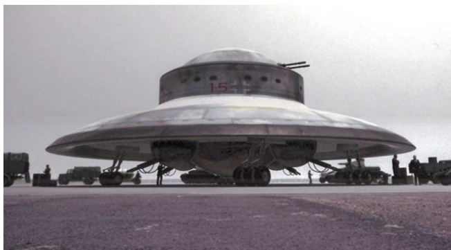
Рис.4. Летающая тарелка третьего рейха [3].

Второй вид аппаратов, назовём их аномальными аппаратами (АА) поскольку не ясен их принцип работы, начал развиваться после того, как в начале 30-х годов прошлого века в Европе начали разработку униполярных генераторов, представляющих собой проводящие тяжёлые диски, разгоняемые до высоких угловых скоростей и затем тормозящиеся в магнитном поле, выдавая ток в миллионы ампер. Щётки для съёма тока располагались на периферии вращающегося диска. Исследователи столкнулись с фактом того, что при разгоне диска в определённый момент вокруг генератора вспыхивал электрический разряд голубоватого цвета, при этом диск продолжал разгоняться, более не потребляя внешнюю электроэнергию. Затем генератор взлетал от пола и улетал на расстояние до 400 м. Скорее всего устройство «случайно» попадало под воздействие вышеупомянутого силового поля. Электрический разряд свидетельствовал о наличии напряжения между щётками и осью генератора порядка нескольких миллионов вольт. При этом создавалась большая подъёмная сила. Магнитное поле Земли скорее всего не могло быть использовано из-за чрезвычайно малой величины (0,5 эрстеда). Поскольку генератор вырабатывает ток очень большой величины, то возможно создание на борту аппарата сверхсильных магнитных полей. По-видимому, это явление было использовано до войны 1941-1945 г.г. в Германии для создания подобных НЛО аппаратов. Имеются фотографии предвоенного времени (рис.4), указывающие на наличие таких устройств[2,3].