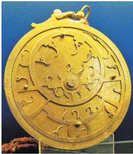
◀ Классическая астролябия. XVIII в., Персия