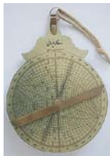
Заркала сзади и спереди