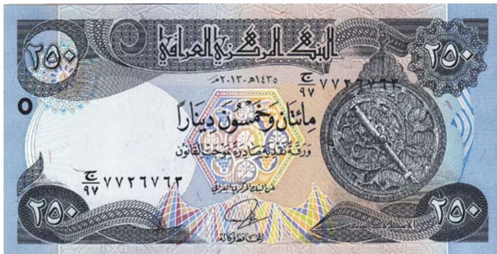
Астролябия на современной купюре 250 динар, Ирак

таблица и таблица тангенсов и котангенсов.