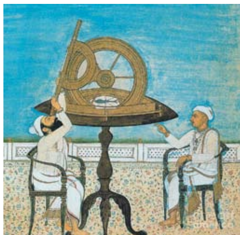
Наблюдатели за звёздным небом пользовались уважением на Востоке

современные средства навигации. Среди различных разновидностей, изготовленных руками мастера, сразу бросается в глаза уже знакомая форма классической астролябии (с арабского «мосаттах» — плоская). Она хорошо известна по древним персидским и арабским текстам и именно такой знает астролябию неспециалист. Классическая астролябия представляет собой «тарелку» с высоким бортом, служащую оправой для сменных круглых дисков с изображением стереографической проекции небесной сферы для различных широт местности. В Иране одна сторона сменного диска иногда проектировалась для двух или даже четырёх различных широт. На материнскую «тарелку» накладывается круглая фигурная решётка — «паук», на которой указано расположение самых ярких звезд