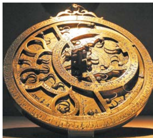
Астролябия заменяла древним часы, компас и навигатор

устройстве мироздания. Сегодня научный мир только приближается к тому, чтобы открыть дверь новым неоспоримым фактам об истории древнего мира, в том числе об этой цивилизации, оставившей нам в