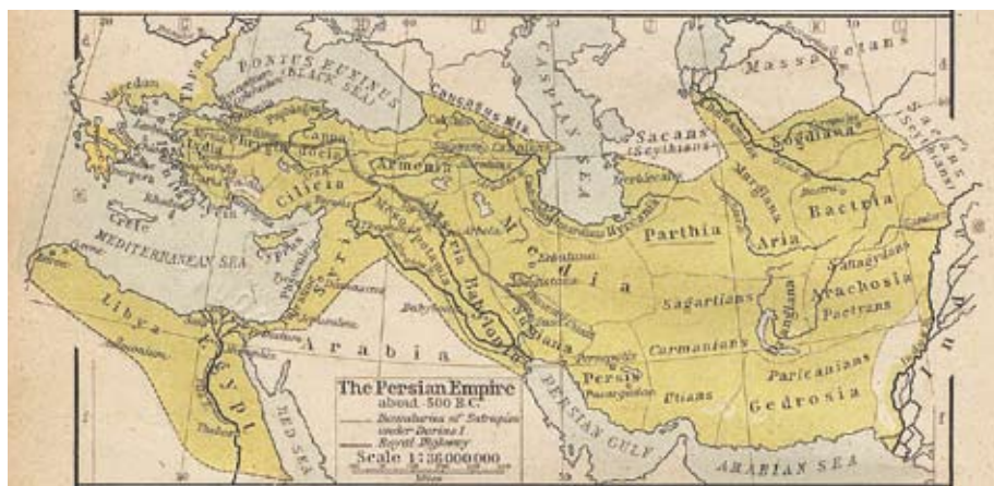
Персидская Империя — одна из самых могучих в истории человечества

ции различных типов астролябии. Занимаясь воссозданием древнеиранского и древнеарийского астрономического наследия, он невольно позволяет и нам с вами вспомнить о том, чем жили наши общие предки многие века назад. Иранский мастер, однако, весьма осторожно относится к предыстории возникновения инструмента и не спешит относить его к достижениям какой-либо конкретной цивилизации, сдержанно намекая лишь на особую роль иранских учёных в развитии и распространении астролябии. Что ж, время покажет! А пока взглянем подробнее на то, что когда-то заменяло человеку часы и