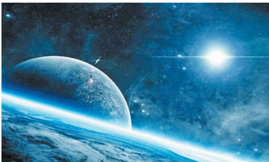
Космос и сегодня можно изучать древним способом

Кроме астролябии, астрономы и инженеры прошлого пользовались и более простым инструментом под названием квадрант, который имел форму четверти круга. Существовало несколько разновидностей квадранта, каждая из которых использовалась для выполнения определенной функции. Так, синусный квадрант служил для решения тригонометрических задач, измерения высоты угла, определения расстояний, а также анализа некоторых астрономических данных. С помощью часового квадранта определяли время по высоте солнца над горизонтом. Квадрант «альмукантар» проектировался по принципу типичной астролябии для определенной географической широты. Однако в XXI в. все три разновидности стараниями иранского умельца уместились в одном квадранте, совмещающем функции трёх. Данный экземпляр приспособлен