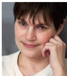
Беседу вела Наталия Лескова

В Россию я верю. Она дала миру множество выдающихся умов, она обладает особой мощью духа, она может стать местом спасения и объединения человечества, таким Ноевым Ковчегом, который поможет выбраться из пучины войны и смерти.